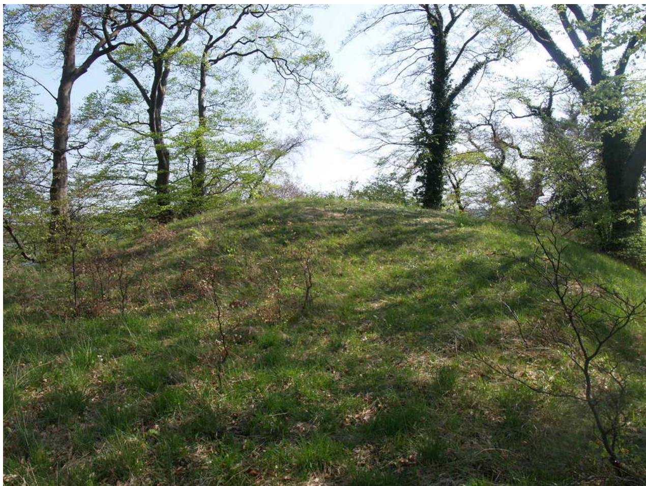
Gravhøj fra bronzealder 1.400 f. Kr.. 12 x 2 x 1 m. På kystskrænten på Bramsnæs.

Fredningsnummer 312545 Sognebeskrivelse 020611-118