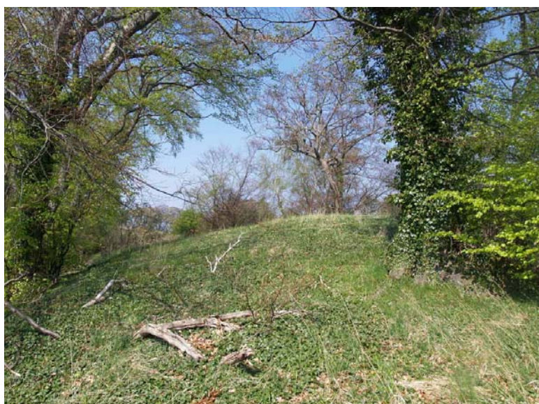
Højen er bevokset med vedben.